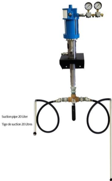
Suction pipe 20 Liter Tige de suction 20 litres