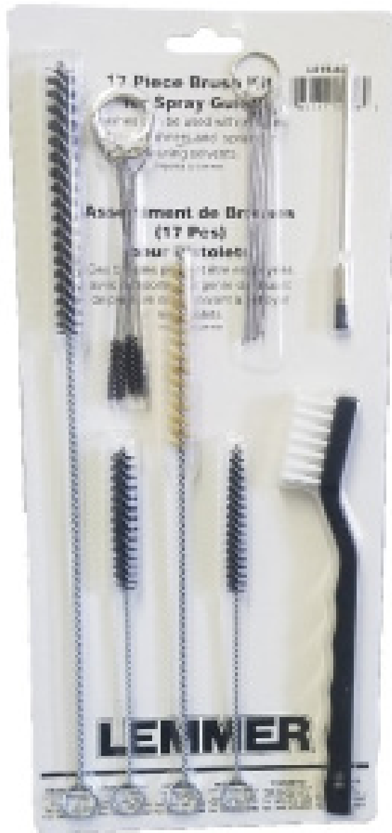
Ensemble d'outils et brosses de nettoyage (17pcs)

Les clients qui ont acheté cet article ont également acheté les accessoires suivants: