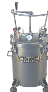
L011-088 5G w/man agi