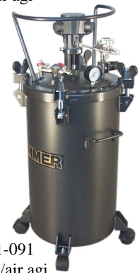
L011-091 10G w/air agi

WARNING. Read all instructions carefully before assembling components and operating sprayer. Incorrect procedure could result in damage to the unit, severe personal injury and/or property damage. When spraying flammable materials, turbine or air compressor must be placed at least 20 feet from target in a well-ventilated area. Vapours can be ignited by static discharge or electrical sparks and result in severe personal injury.