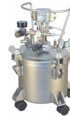
L011-060 2.2G SS w/air agi