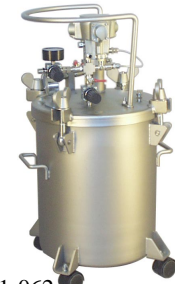
L011-062 5G SS w/air agi