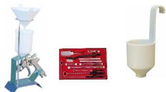
L015-605 L015-604 L034-191