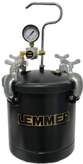
L011-126 2.25 Gallons

Ces cuves sont conçues pour le coulage sous pression des caoutchoucs et plastiques liquides. Le coulage sous pression des résines permet d'obtenir des pièces pratiquement sans bulles. La pression recommandée est de 60 psi. (Peut aller jusqu'à 70 psi). Compresseur à air non inclus.