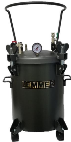
L011-127 5 Gallons